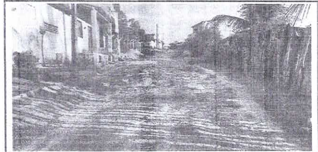
FOTO Nº RUA 8 DE DEZEMBRO - NOVO SANTO ANTÔNIO - GUAÍUBA - CE 2 JULHO 2023