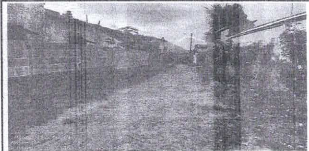
FOTO Nº RUA 8 DE DEZEMBRO - NOVO SANTO ANTÔNIO - GUAÍUBA - CE 1 JULHO 2023

VISITA TÉCNICA: PARA PROJETO DE PAVIMENTAÇÃO NO DISTRITO DE ÁGUA VERDE E NA SEDE, NO MUNICÍPIO DE GUAÍUBA - CE