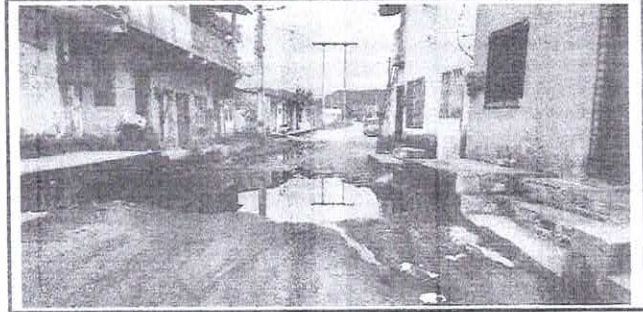
FOTO Nº RUA MANOEL MOREIRA - ÁGUA VERDE - GUAÍUBA - CE 2 JULHO 2023