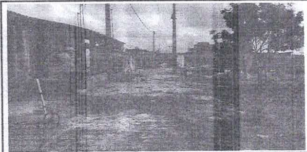
FOTO Nº RUA MANOEL MOREIRA - ÁGUA VERDE - GUAÍUBA - CE 1 JULHO 2023

VISITA TÉCNICA: PARA PROJETO DE PAVIMENTAÇÃO NO DISTRITO DE ÁGUA VERDE E NA SEDE, NO MUNICÍPIO DE GUAÍUBA - CE