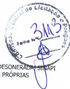
TABELA: SEINFRA 27.1 DESONERADA SINAPI 05/2022 DESONERADA E PRÓPRIAS BDI: 25,92%