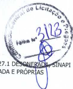
TABELA: SEINFRA 27.1 DESONERADA, SINAPI 05/2022 DESONERADA E PRÓPRIAS BDI: 25,92%

OBRA: REFORMA E AMPLIAÇÃO DA ESCOLA MARIA DE LOURDES PEREIRA LOCAL: BAÚ, GUAÍÚBA-CE REF.: TOMADA DE PREÇOS Nº 05.005/2022-TP RAZÃO SOCIAL: CLEZINALDO S. DE ALMEIDA CONSTRUÇÕES - ME CNPJ: 22.575.652/0001-97