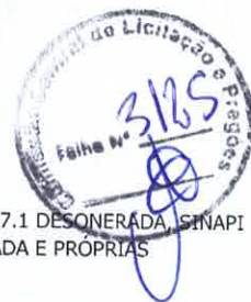
TABELA: SEINFRA 27.1 DESONERADA SINAPI 05/2022 DESONERADA E PRÓPRIAS BDI: 25,92%