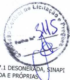
TABELA: SEINFRA 27.1 DESONERADA, SINAPI 05/2022 DESONERADA E PRÓPRIAS BDI: 25,92%