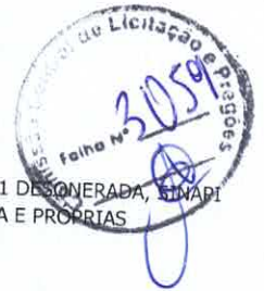
TABELA: SEINFRA 27.1 DESONERADA, SEINFRA 05/2022 DESONERADA E PRÓPRIAS BDI: 25,92%