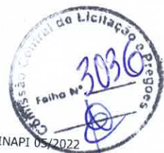
TABELA: SEINFRA 27.1 DESONERADA, SINAPI 05/2022 DESONERADA E PRÓPRIAS BDI: 25,92%