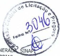
TABELA: SEINFRA 27.1 DESONERADA SINAP 05/2022 DESONERADA E PRÓPRIAS BDI: 25,92%