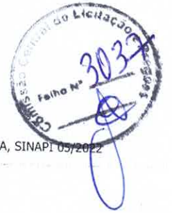
TABELA: SEINFRA 27.1 DESONERADA, SINAPI 05/2022 DESONERADA E PRÓPRIAS BDI: 25,92%