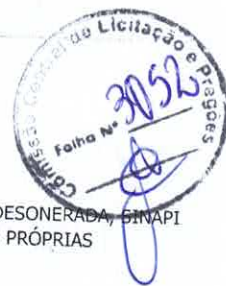
TABELA: SEINFRA 27.1 DESONERADA, DINAPI 05/2022 DESONERADA E PRÓPRIAS BDI: 25,92%

OBRA: REFORMA E AMPLIAÇÃO DA ESCOLA MARIA DE LOURDES PEREIRA LOCAL: BAÚ, GUATUBA-CE REF.: TOMADA DE PREÇOS Nº 05.005/2022-TP RAZÃO SOCIAL: CLEZINALDO S. DE ALMEIDA CONSTRUÇÕES - ME CNPJ: 22.575.652/0001-97