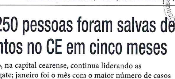
É recomendado que os banhistas prefiram escolher locais próximos a postos de guarda-vidas

Segurança. A Polícia Civil do Ceará informou que o número de pessoas presas por suspeita de envolvimento nas mortes que ocorreram no bairro Barroso, na última sexta-feira, 21, aumentou. Além das três capturas do fim de semana, as autoridades localizaram outros dois suspeitos, ambos já tinham antecedentes criminais.