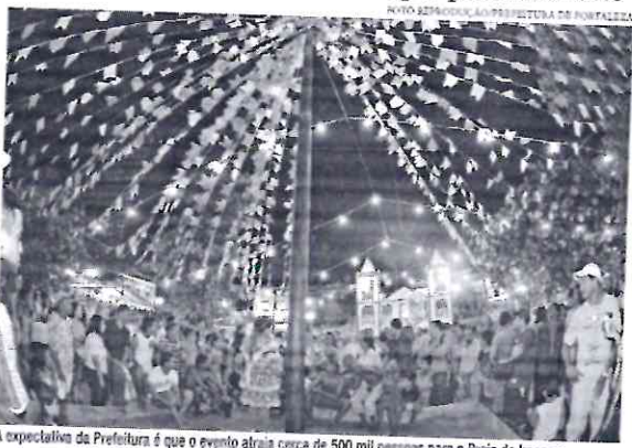
A expectativa da Prefeitura é que o evento atraia cerca de 500 mil pessoas para a Praia de Iracema

Após a polêmica envolvendo a contratação da dupla Victor & Leo, que teve o show cancelado devido às críticas pelo fato do cantor Victor já ter sido condenado por ter agredido sua mulher em 2019, o prefeito informou, na última terça-feira, 18, que Xand Avião seria o substituto. "Determinei a substituição da dupla Victor e Leo em nosso São João. Mesmo que os cachês dos artistas sejam pagos por patrocinadores, trata-se de