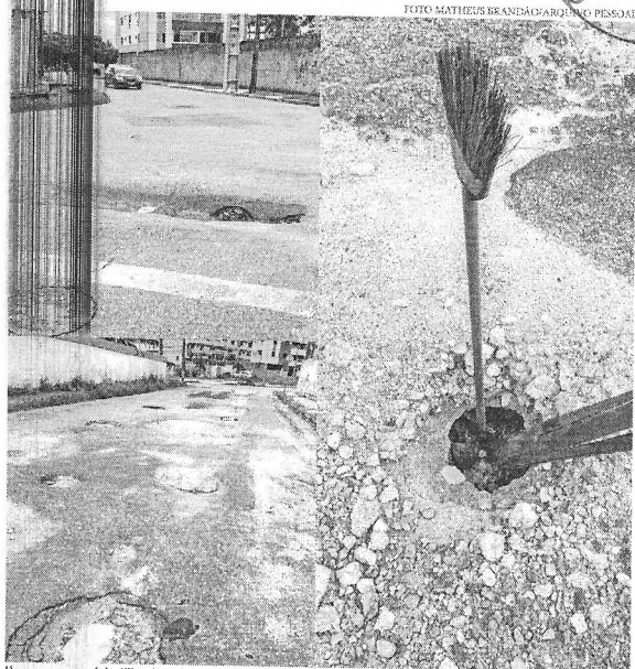
Uma vassoura foi utilizada pelos moradores para auxiliar motoristas na visualização do buraco

Em um outro ponto do Papicu, onde as ruas Emídio Lobo e a Almeida Prado se encontram, há relatos de veículos que perderam peças por conta de uma depressão existente no asfalto. "A gente se sente muito prejudicado porque, muitas vezes, quando entramos ou saímos da rua, o carro é danificado. Já foram vários os veículos