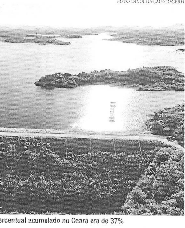
cauteloso e prudente da água, pois vivemos em uma região semiárida e não podemos ter certeza de como será a próxima quadra chuvosa", alerta Tavares.

O território cearense deu início à quadra chuvosa deste ano com um percentual de 37% quanto ao acumulado dos reservatórios monitorados pela Cogerh, ou seja, o crescimento até o momento é de 12,5%. Mesmo assim, a Companhia vem reforçando que é necessário aguardar o fim da estação para avaliar o cenário com precisão. "Até lá, é importante lembrar do uso