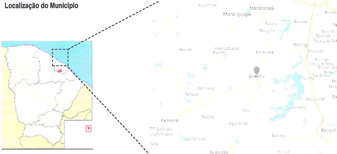
Situação do Município