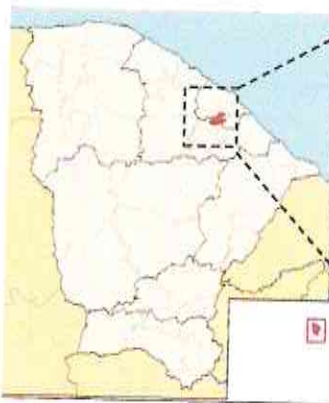
Localização do Município