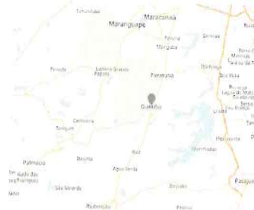
Situação do Município