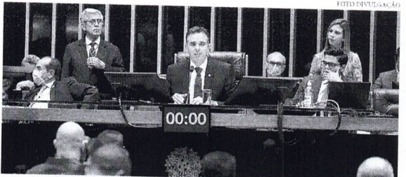
As negociações em torno da PEC, que eleva o teto e libera R$ 168 bil em despesas patinam desde a semana passada

TEMPO NO BRASIL (Máxima) São Paulo 22°C • Brasília 22°C • Rio 23°C FALE COM A GENTE www.estadonline.com.br e-mail: gerald@estadonline.com.br